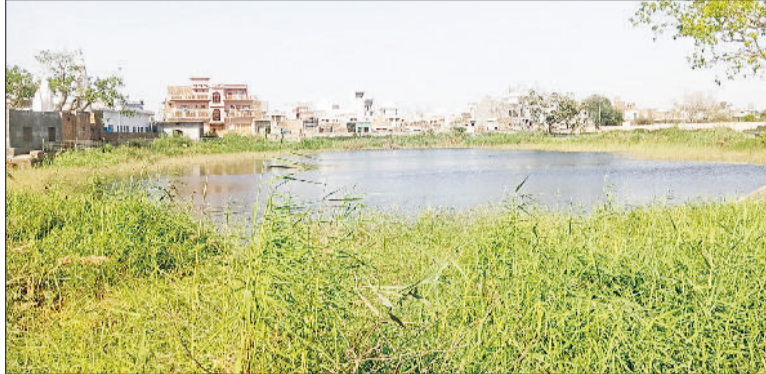
बवानीखेड़ा। बवानीखेड़ा में बाबा कमल मंदिर के साथ लगती झील का डरावना दृश्य।

शहरवासियों और श्रद्धालुओं का कहना है कि झील के आसपास अब घनी झाड़ियां, सरकंडे उग आए हैं, जिससे यह स्थान सुनसान और भयावह नजर आने लगा है। दिन के समय भी यहां जाने पर डर लगता है।