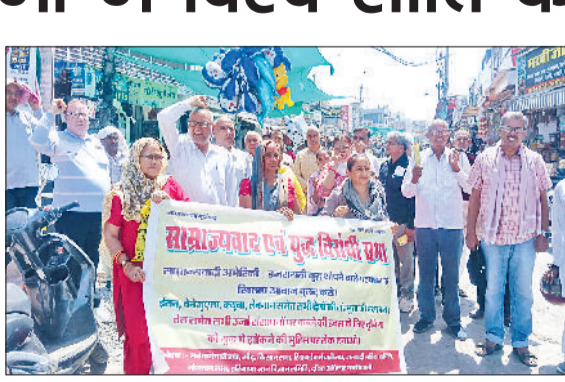
भिवानी। युद्ध विरोधी व विश्व शांति के लिए जुलूस निकालते जनसंगठनों के सदस्य।

विभिन्न जनसंगठनों सर्व कर्मचारी संघ, किसान सभा, सीटू, जनवादी महिला समिति, रिटायर्ड कर्मचारी संघ, ज्ञान-विज्ञान समिति, जनवादी नौजवान सभा व दलित अधिकार मंच के कार्यकर्ताओं ने इजराइल-अमेरिकी साम्राज्यवादी युद्ध के विरोध तथा विश्व शांति के पक्ष में शुक्रवार को नेहरू पार्क से घंटाघर चौक तक प्रदर्शन कर जुलूस