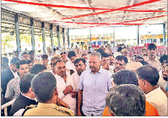
चरखी दादरी। रेली स्थल का निरीक्षण करते विधायक व अधिकारी।

उन्होंने समारोह स्थल पर मुख्यमंत्री के मंच व लोगों के बैठने के लिए जगह का बारीकी से अवलोकन किया और कार्यक्रम स्थल पर बैरिकेटिंग, आमजन के आवागमन को लेकर आवश्यक