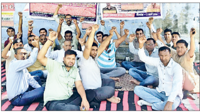
मिवाणी। हड़ताल के दौरान नारेबाजी करते दमकल विभाग के कर्मचारी।

हड़ताल के तीसरे दिन धरने पर न केवल दमकल कर्मचारी, बल्कि विभिन्न विभागों के दिग्गज कर्मचारी नेताओं ने पहुंचकर लड़ाई में अपना समर्थन दिया। तीसरे दिन की हड़ताल पर धरने को